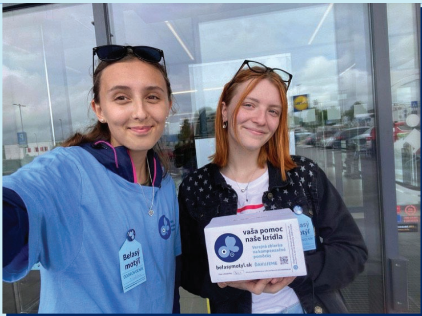
Dobrovoľníčky zo Súkromnej strednej odbornej školy pedagogickej v Žiari nad Hronom