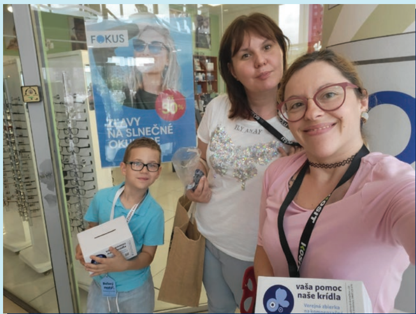
Dobrovoľnícky tím Košice