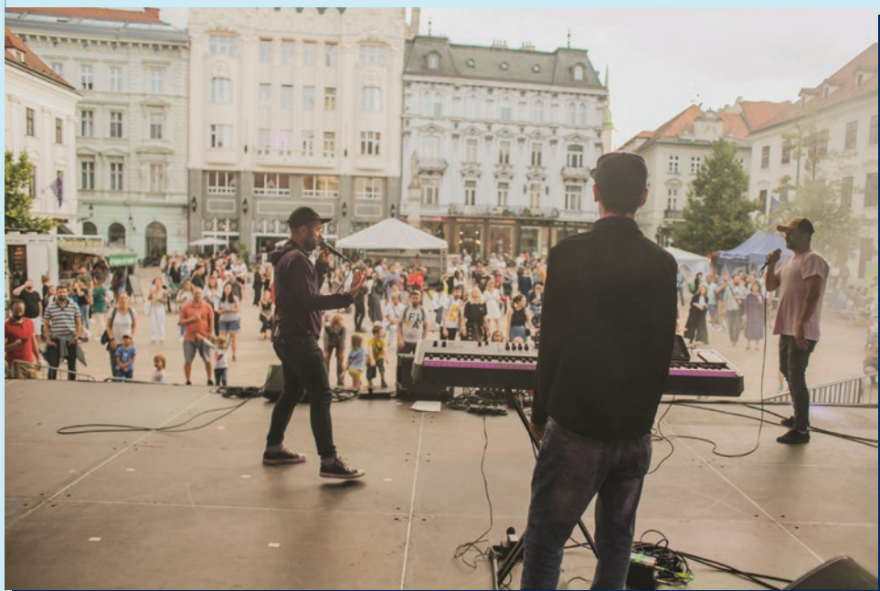
Skupina Modré Hory na Hlavnom námestí v Bratislave