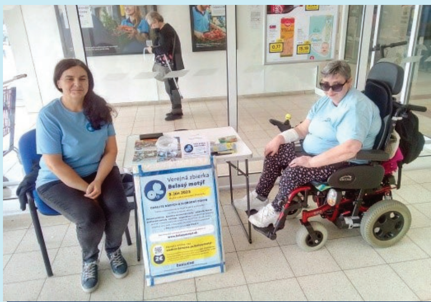
Dobrovoľnícky tím Púchov