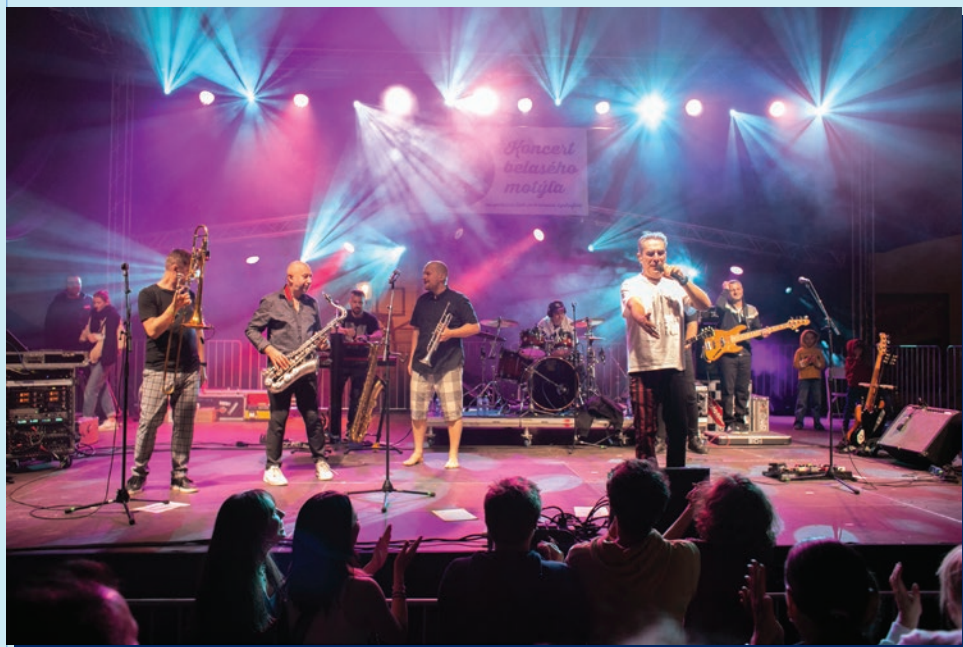
Skupina Polemic na Hlavnom námestí v Bratislave