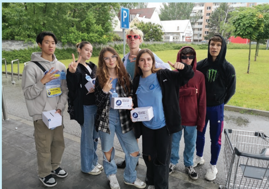
Dobrovoľnícky tím Piešťany