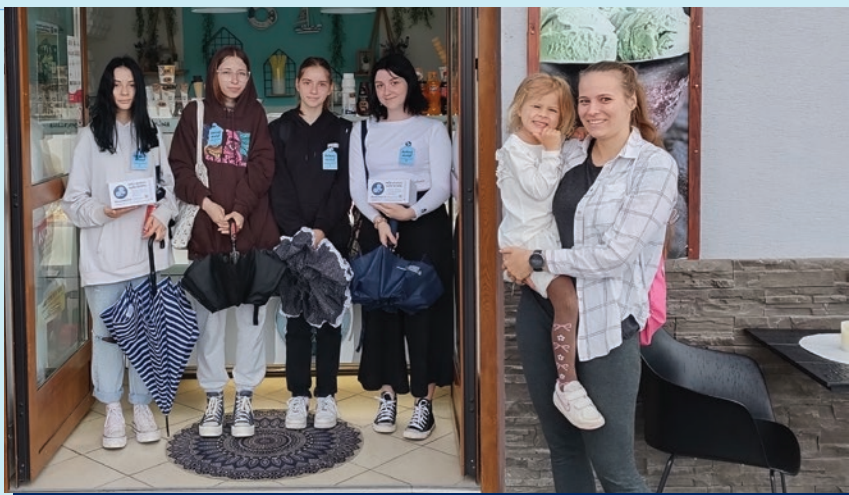
Dobrovoľnícky tím Kropachy