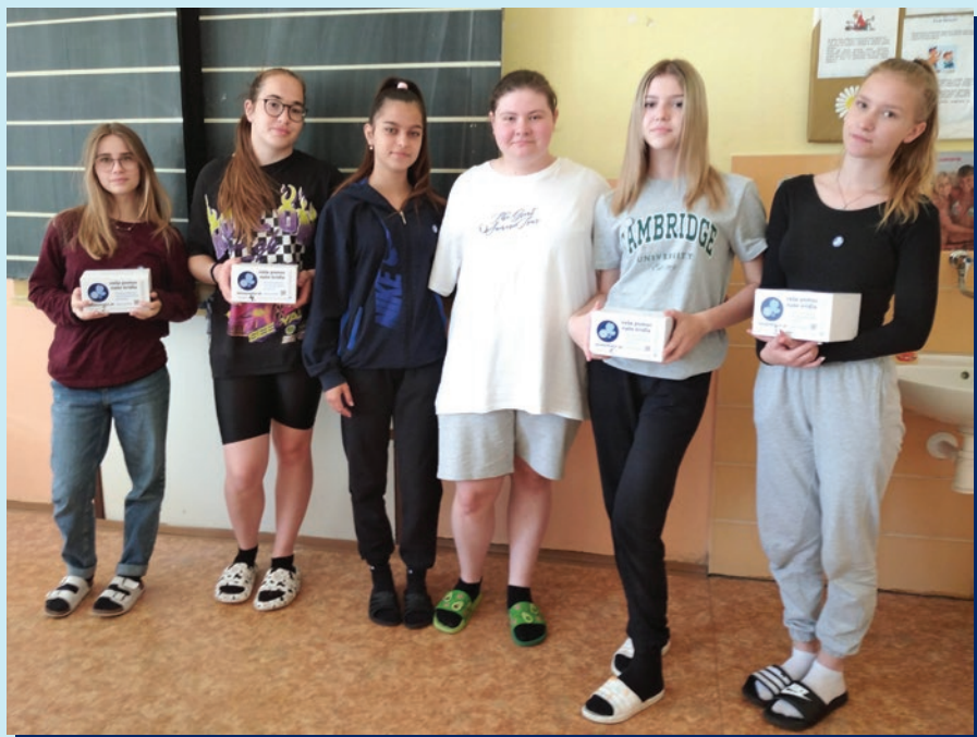
Dobrovoľnícky tím Závod