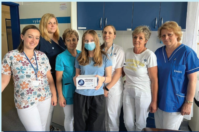
Dobrovoľnícky tím Košice, Krompachy, Spišská Nová Ves