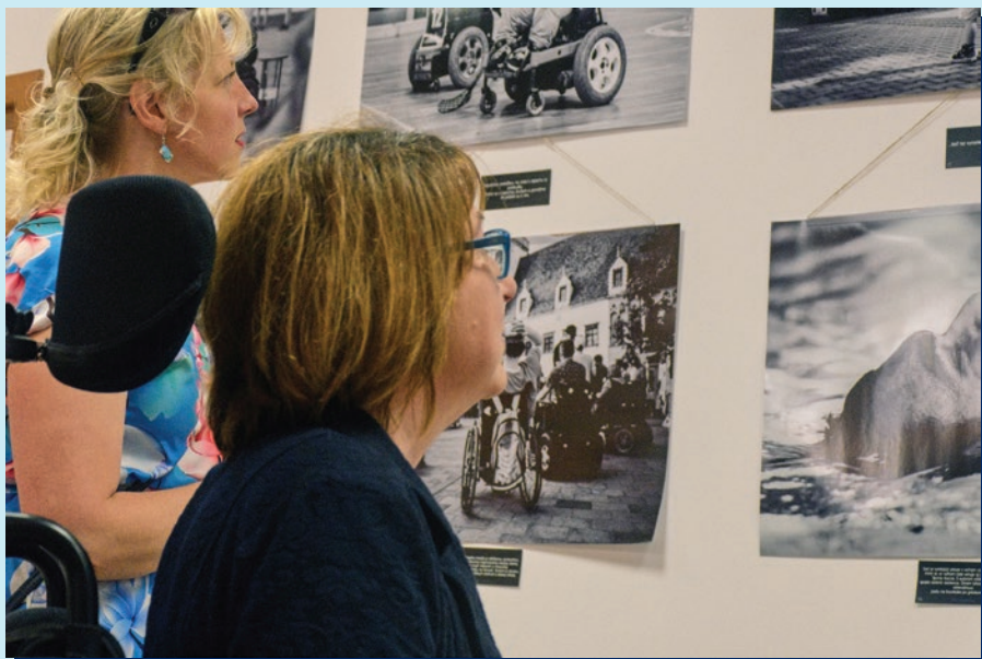
Návštevníčky obdivujú vystavované fotografie Pavla Kulkovského

Jubilejná desiatu spanilá mala už tradične svoj štart aj cieľ na parkovisku pred hypermarketom TESCO na Zlatých pieskoch. Na každú motorku aj športové auto uväzovali naše dobrovoľníčky