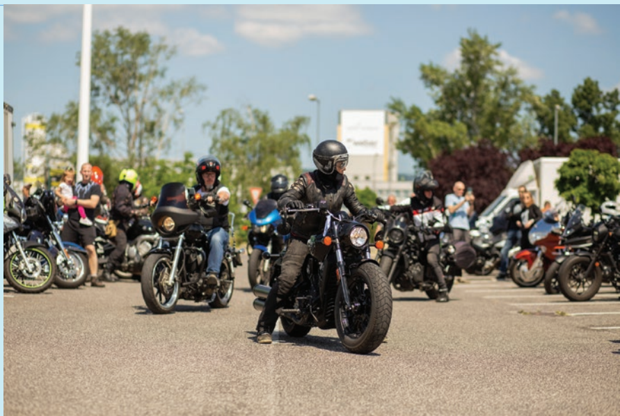
Akciu "Silné motory podporujú slabé svaly" podporili desiatky motorkárov a športových áut