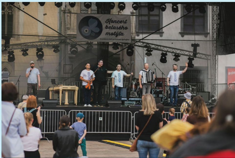
Ľudová hudba v podaní skupiny Sokoly na Hlavnom námestí v Bratislave