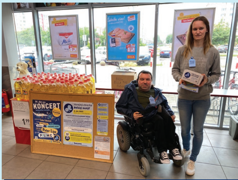
Dobrovoľníci Billa Petržalka