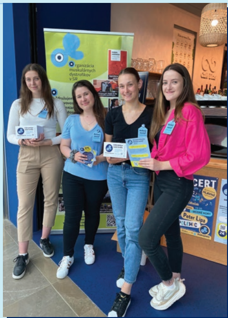
Dobrovoľníčky Aupark Pantarhei