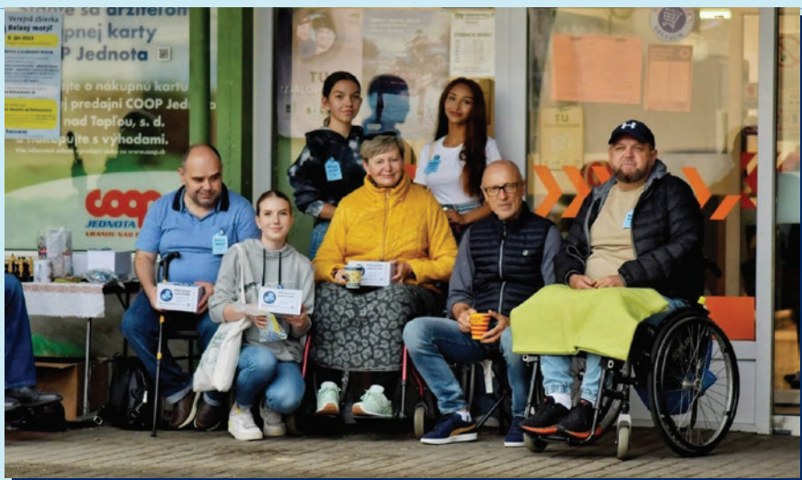
Dobrovoľnícky tím Vranov ad Topľou