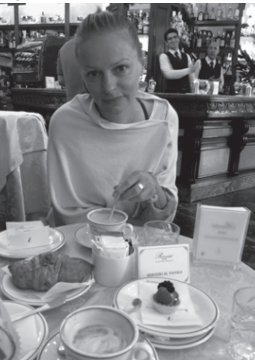
• Talianske raňajky vo Florencii chutili výborne.

obklopené prírodou, s terasou a výhľadom otočeným do krajiny. Západy slnka z nej boli našim top zážitkom tejto dovolenky. Odtiaľto sme vyrážali každý deň na krátke výlety do okolia, túlili sa po viniciach, prašných cestách, chvílkami netušiac kam nás dovedú. Oblať nazývaná Chianti patrí do oblasti najlepších vín na svete. Popozerali sme si mestečká krásne porozhadzované na vrcholoch kopčekov, postavené z kameňa, dýchajúce históriou. Takto sme skúmali okolie, voziac sa kľukatými cestičkami z vrška na vršok, a to doslova, pretože tento kraj je zvlnený ako more. Stále sa buď škriabete na kopček a hneď zase klesáte, a tak stále dookola. Boli sme užasnutí, keď sme videli traktor orúci také strmé