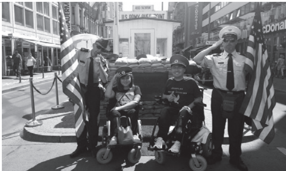
• Slávny Checkpoint Charlie, kde za fotografiu zaplatíte tri eurá!

hlboko uprostred, máte pocit, že sa všetko naokolo s vami točí a vo vás to vzbudzuje pocit neistoty.