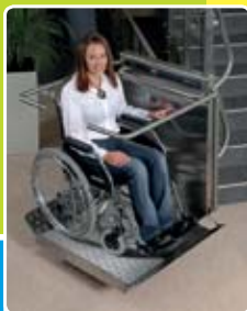
Vnútorňá šikmá plošina do zákrut