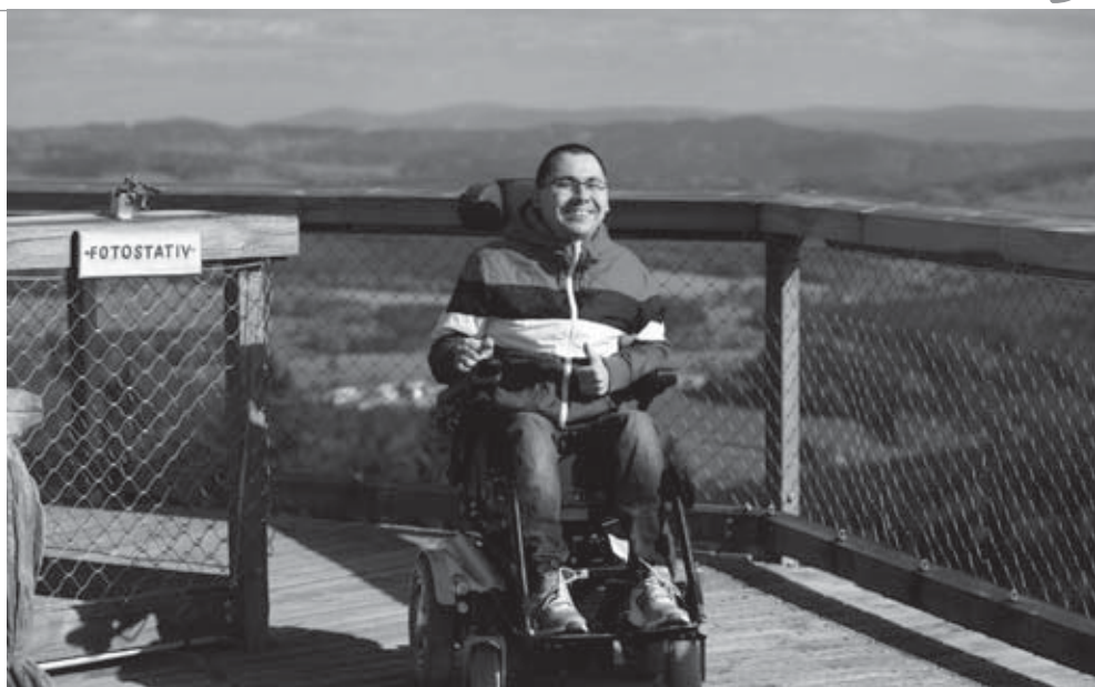
• Nádherný výhľad z najvyššieho bodu výhľadne stál skutočne za to!

sa pozrieť na Stezku v Lipne, ktorú sme pred tým videli len na internete. Najskôr som hľadal všetky informácie o prístupnosti pre vozičkárov, ktoré som dopodrobna rozpísané našiel na prislúchajúcej webovej stránke. Priamo v Lipne sme si rezervovali bezbariérový hotel vhodný aj pre dvoch ľudí na elektrickom vozíku. Najlepšie podmienky pre nás mal Hotel Star Lipno, ktorý okrem toho, že bol naozaj prístupný, mal ako bonus aj bezbariérový prístup na balkón s krásnym výhľadom na vodnú nádrž Lipno.