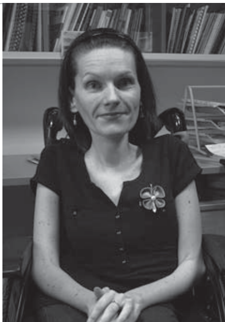
🕒 finančný dar 25 €: Brošňa