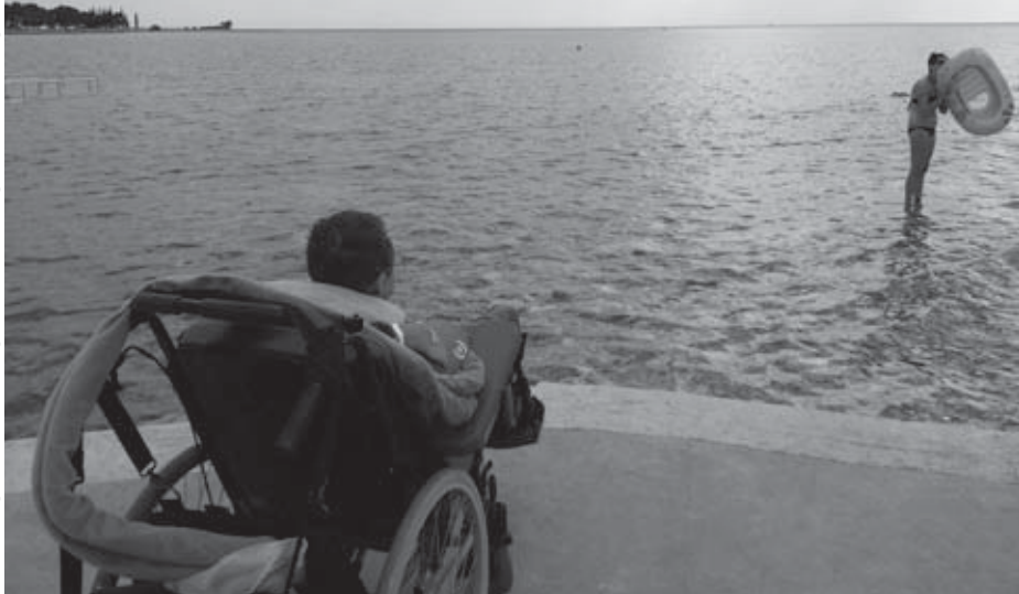
• Výhľady na širé more si Robkovi dodali mnoho energie.

seba i auto. Veď nič sa nesmie nechať na náhodu! Umag Apartments Polynesia na Istrii bolo teda cieľom našej cesty.