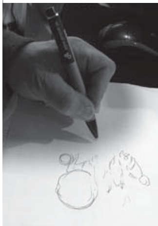
🕒 finančný dar 3 €: Ľahučké ekopero