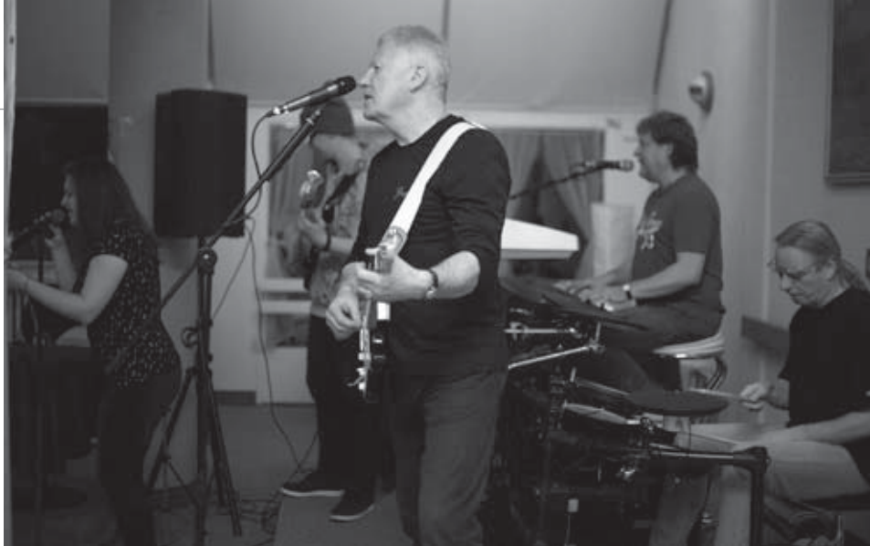
• Do tanca a spevu nám zahrala a zaspievala hudobná skupina Rockoko.