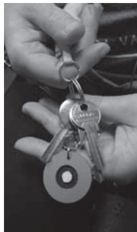
🕒 finančný dar 3 €: Prívesok na kľúče