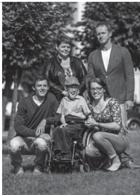
• Sympatická rodinka vždy spolu, v dobrom aj v zlom.

Asi vás nikdy nenapadlo zamyslieť sa nad tým, aké problémy rieši vozičkár predtým, než sa vyberie na cudzie miesto. Rozhoduje sa, či zoberie mechanický alebo elektrický vozík. Kto má väčšie auto, berie oba. Pýtate sa, prečo? Je to aj náš prípad. Balíme oba. Tadeáš by bol najradšej vždy na elektrickom vozíčku. Cíti sa slobodnejší a nie je odkázaný na našu pomoc. Ovláda si ho sám, ide kam chce a kedy chce. No stačí