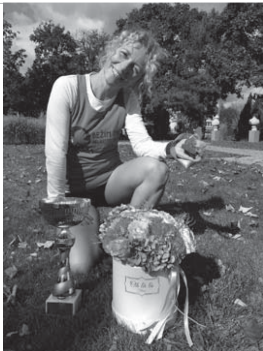
• Zlatá medaila v tričku Belasého motýľa z podujatia Čunovský beh v októbri 2017.