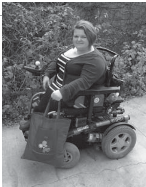
🕒 finančný dar 5 €: Nákupná bavlnená taška