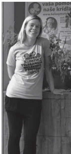
🕒 finančný dar 10 €: Bavlnené tričko s motívom Koncertu belaseho motýľa