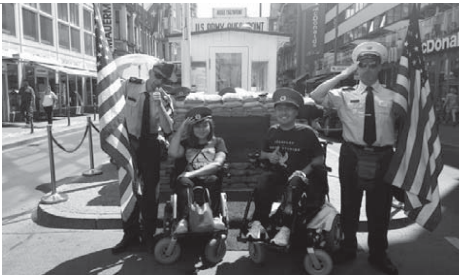
• Slávny Checkpoint Charlie, kde za fotografiu zaplatíte tri eurá!

hlboko uprostred, máte pocit, že sa všetko naokolo s vami točí a vo vás to vzbudzuje pocit neistoty.