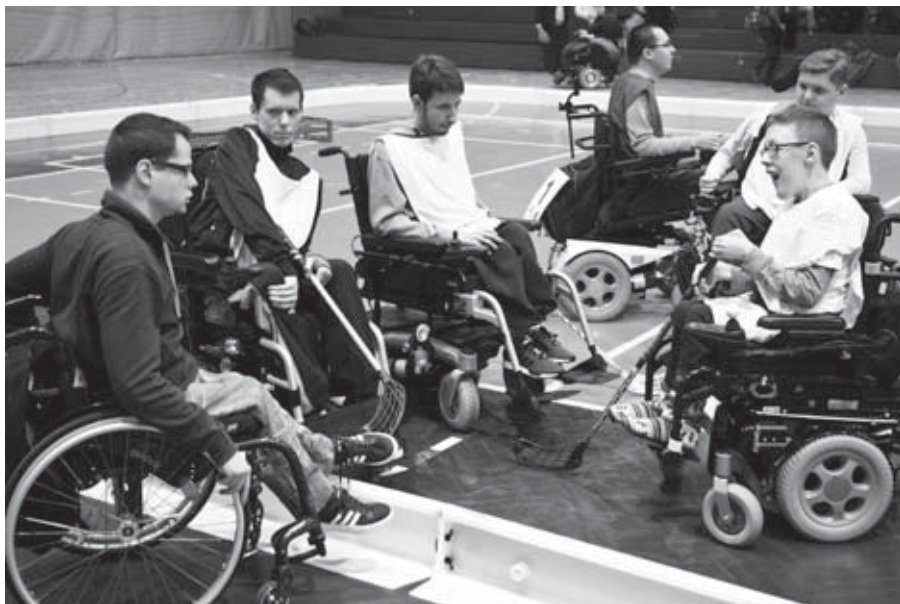
• Športová porada pred zápasom samozrejme nesmie chýbať.