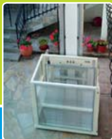
Zvislá plošina bez ohradenia