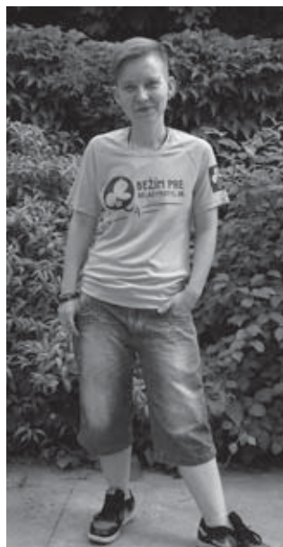
🕒 finančný dar 10 €: Bežecké bavlnené tričko