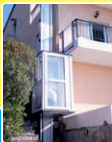
Zvislá kabínová plošina bez ohradenia