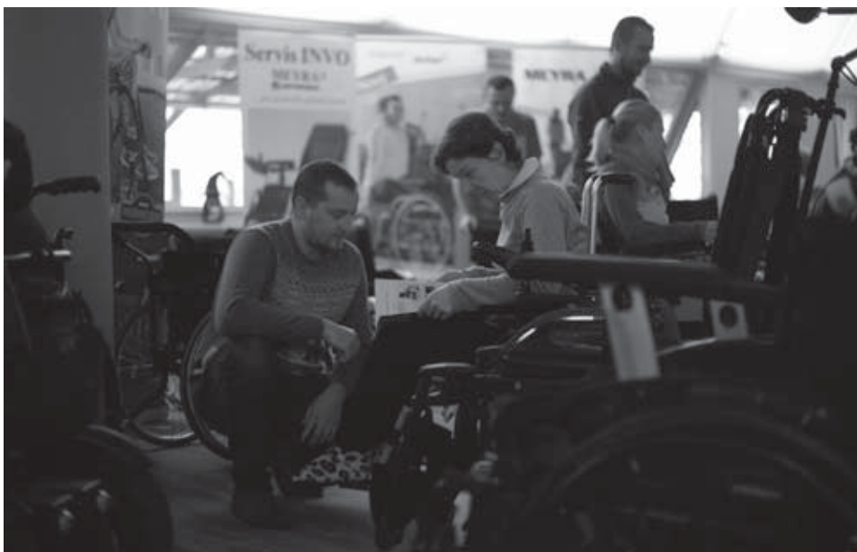
• Až desať firiem prezentujúcich kompenzačné pomôcky sa s nami podelili o rady a novinky.