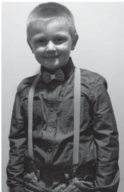
🕒 finančný dar 25 €: Detský set (traky + motýlik)