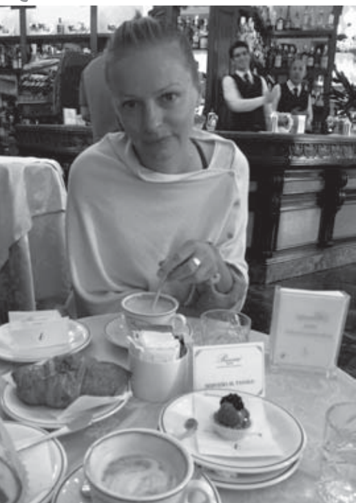
• Talianske raňajky vo Florencii chutili výborne.

obklopené prírodou, s terasou a výhľadom otočeným do krajiny. Západy slnka z nej boli našim top zážitkom tejto dovolenky. Odtiaľto sme vyrážali každý deň na krátke výlety do okolia, túlili sa po viniciach, prašných cestách, chvílkami netušiac kam nás dovedú. Oblasť nazývaná Chianti patrí do oblasti najlepších vín na svete. Popozerali sme si mestečká krásne porozhadzované na vrcholoch kopčiekov, postavené z kameňa, dýchajúce históriou. Takto sme skúmali okolie, voziac sa kľukatými cestičkami z vrška na vršok, a to doslova, pretože tento kraj je zvlnený ako more. Stále sa buď škriabete na kopček a hneď zase klesáte, a tak stále dookola. Boli sme užasnutí, keď sme videli traktor orúci také strmé