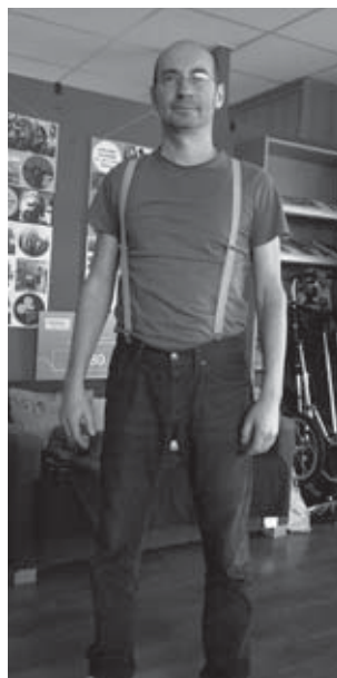
🕒 finančný dar 8 €: Traky pre dospelých