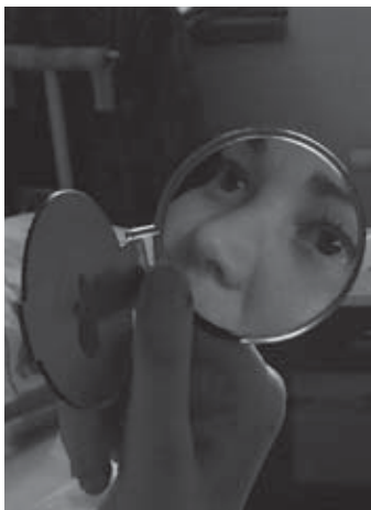
🕒 finančný dar 5 €: Zrkadielko