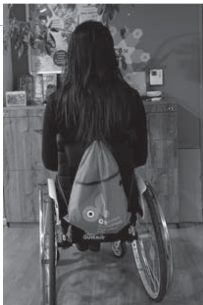
🕒 finančný dar 7 €: Športový vak