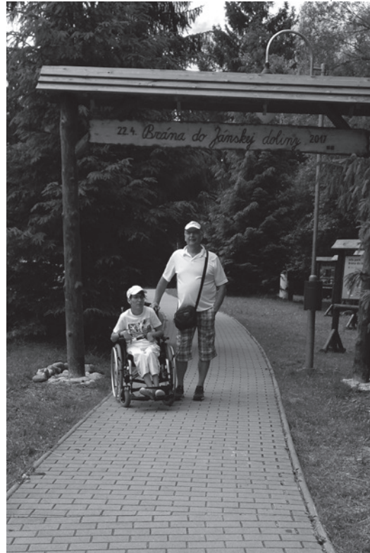
• Brána do Jánskej doliny vedie bezbariérový chodník, ktorý je ako stvorený na prechádzky s vozíkom.

Ubytovali sme sa vo Svätójánskom kaštieli. Kaštieľ má ubytovaciu kapacitu 25 izieb. My sme boli ubytovaní na prízemí, nakoľko sa v celom objekte nenachádza výtah. Kaštieľ disponuje jednou bezbariérovou izbou. Budova kaštieľa je zo 17. storočia a tomu je prispôbený nábytok v izbách. Má rustikálny charakter, vďaka čomu sa človek v nich cíti veľmi príjemne. Žiadne bariéry som