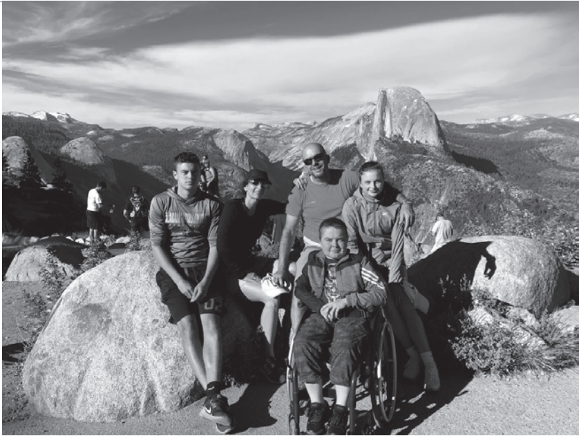
• Vyhládka Glacier point nad Yosemite Valley, v pozadí skalný vrchol Half Dome.

jedlo. Potom sme vyrazili do mesta Sonora, kde sme len prespali a ďalší deň sme strávili v Yosemitejskom národnom parku. Išli sme do turisticky najnavštevovanejšej oblasti parku, do Yosemite Valley. Je to údolie obklopené granitovými horami, z ktorých najznámejšie sú Half Dome a El Capitan. Ako prvý sme navštívili Lower Yosemite Fall, kam viedla bezbariérová cesta. Upper Fall je ešte vyšší, ale k nemu sa dalo dostať dlhšou túrou. Potom sme sa autobusom, ktorý zadarmo premáva po údolí a je bezbariérový, previezli k jazeru Mirror Lake. Od zastávky tam viedla asfaltová cesta. Nebolo to vlastne jazero, ale úsek rieky čiastočne prehradený zosuvom skál. V jazere sa ľudia aj kúpali. My sme si len namočili nohy. Cestou späť sme sa zastavili ešte pri skalnej stene El Capitan. Ďalekohľadom sme pozorovali