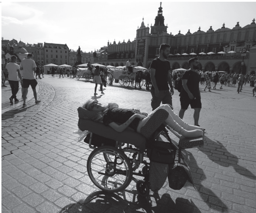
• Krátko po príchode do Krakova na Hlavnom námestí (Rynek Główny).

vypočítať, na koľko miest môžem ísť, kým sa baterka v mojom prístroji nerozhodne, že dýchania mi stačilo.