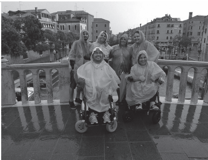
• Jediná fotografia z výletu v Benátkach. Kvôli neutíchajúcejmu výdatnému dažďu nebolo možné použiť fotoaparáty, ani mobilné telefóny.

nakoniec písať nezačal kvôli bariérovosti trajektu. To nás našťastie neodradilo. Nasadli sme do našej bezbariérovej dodávky a vidina pekných fotiek, pravej talianskej pizze a temperamentných talianov nás hnala vpred.