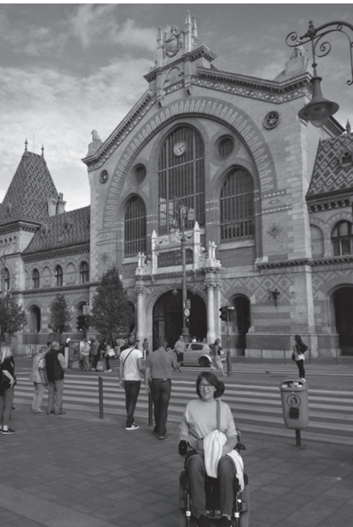
• Pred budapeštianskou tržnicou, ktorá sa nachádza v krásnej historickej budove.