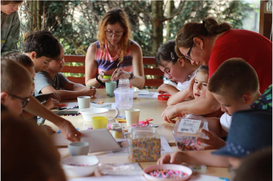
Tvorivé aktivity na detskom tábore